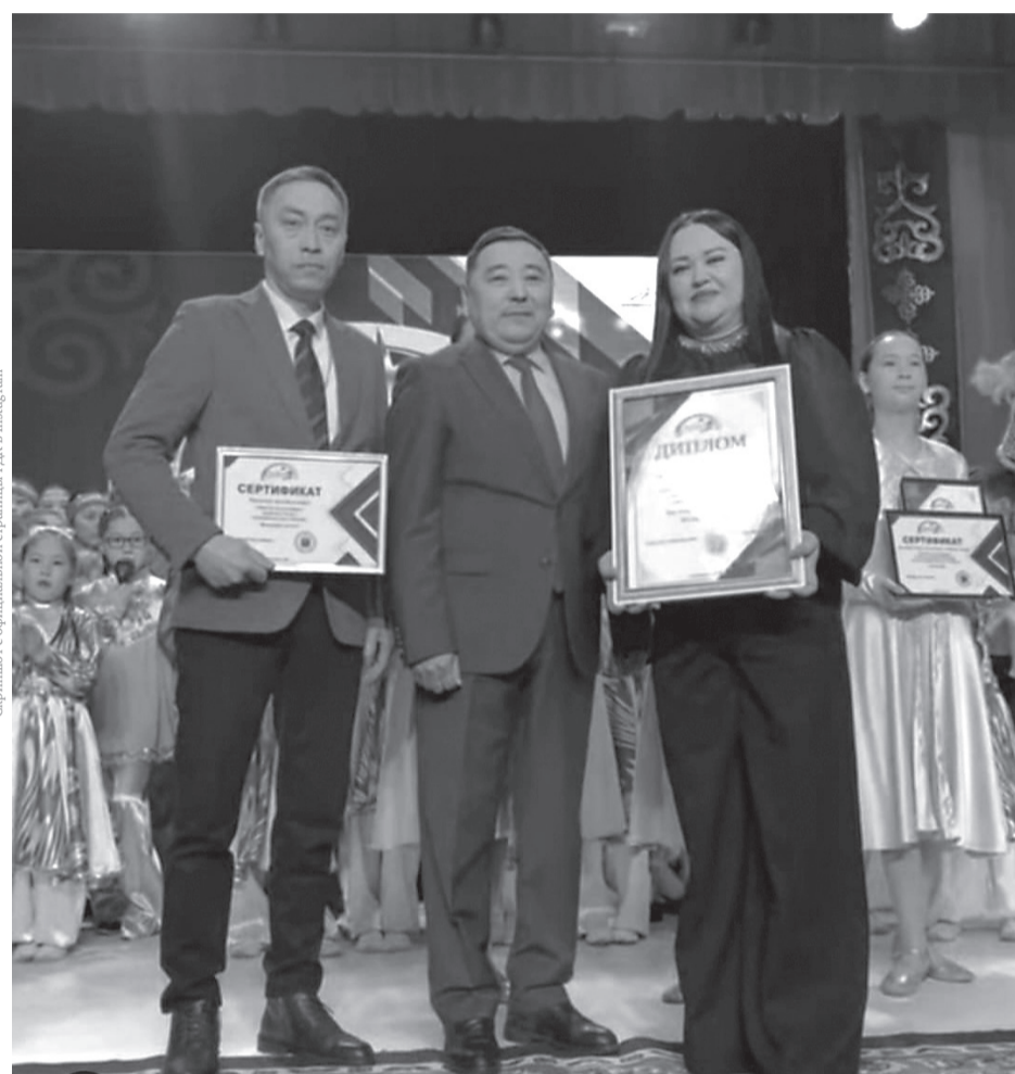
Скриншот с официальной страницы ЭК в Instagram