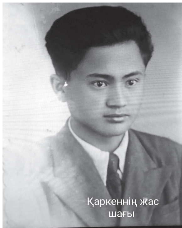
Қаркеннің жас шағы

Жуырда, нақты айтқанда, 26 қаңтарда Қаркен Ахметовтің туғанына 96 жыл толды. Жалпы, республика жұртшылығы, еліміздегі спорт сүйер қауым Қаркен Ахметовті Қазақстанда Мемлекеттік спорт комитеті құрылғанда, яғни 1959-1971 жылдары Қаз КСР-дің Дене шынықтыру және спорт комитетін тұңғыш басқарған қазақ спортшының көсемі ретінде біледі. Иә, ол кісінің жай ғана кресло иемденген шенеунік емес, білікті басшы, нағыз спорт жанашыры екенін, 1960-1970 жылдары атақ-даңқы бүкіл Кеңес Одағына мәлім болғанын баспасөз беттерінде жарық көріп жатқан спорт ардагерлерінің пікірлерінен білеміз.