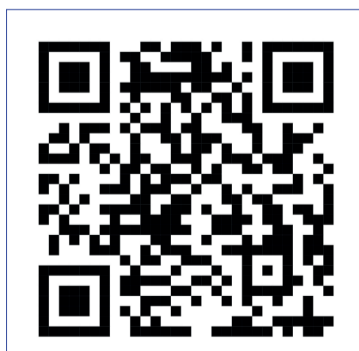
Смотрите видео через QR-код

Во время обсуждения проблемы насилия в обществе были затронуты вопросы не только физического, но и психологического насилия, которое часто остаётся незамеченным, хотя наносит не менее серьезный вред. Запугивание, эмоциональное давление и унижение подрывают здоровье личности и гармонию в обществе. Насилие в любой его форме неприемлемо и не должно быть оправдано.