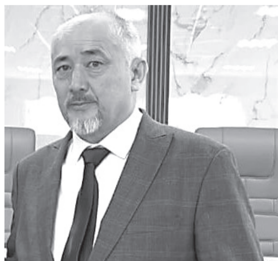
жаңғыруды үйлестіре білген, болашақ ұрпақ алдындағы жауапкершілікті терең сезінетін тұғырлы құжат деп бағалауға толық негіз бар.

Жалпы алғанда, жаңа Конституция жобасын Әділетті Қазақстан идеясын нақты құқықтық мазмұнмен толықтыратын, тұрақтылық пен