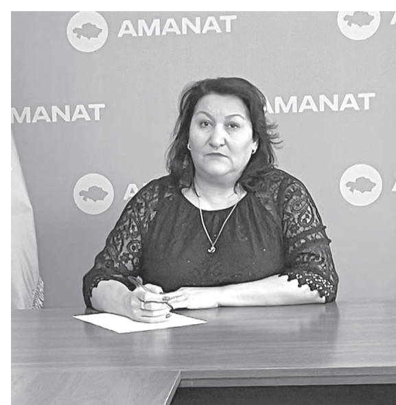
құқықтық мемлекетті одан әрі нығайтуға бағытталған маңызды стратегиялық құжат ретінде оң бағалауға лайық.

Жалпы алғанда, жаңа Конституция жобасы елдің саяси жүйесін жаңғыртуға, азаматтардың мемлекеттік шешімдер қабылдау үдерісіне қатысу мүмкіндігін кеңейтуге және Қазақстанда