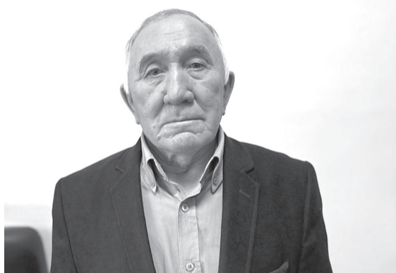
гін көрсетеді. Бұл серіктестердің сенімін және халықаралық стандарттарды сақтауды нығайтады.

Шекараға қолсұғылмаушылық пен аумақтық тұтастықты бекіту де мемлекеттің халықаралық аренадағы ұстанымын күшейтеді. Қазақстан егемендікке және өз тәуелсіздігін қорғауға бейілділі-