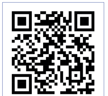
Смотрите видео через QR-код

Подводя итог, можно отметить, что оперативно-профилактическое мероприятие «Безопасный двор» в Ерейментауском районе эффективно решает сразу несколько задач: предотвращает правонарушения, повышает безопасность в жилых зонах и помогает людям, которые столкнулись с трудностями и нуждаются в поддержке. Программы, направленные на профилактику преступности, с участием местных властей, социальных служб и полиции, позволяют снизить уровень правонарушений и создавать более безопасную и стабильную атмосферу для всех жителей.