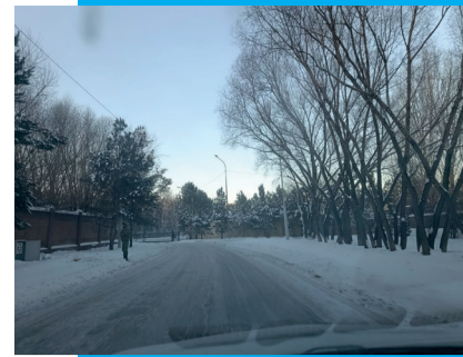
6-БЕТ | БЕЗОПАСНОСТЬ

Қараөткел-2 шағын ауданындағы Ерейментау көшесі елорданың жаңа тынысын айқындайтын бір маңызға ие.